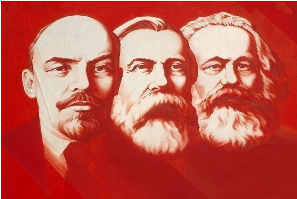
Οι Πατέρες του κομμουνισμού ΒΛΑΝΤΙΜΙΡ ΛΕΝΙΝ ,ΦΡΙΝΤΡΙΧ ΕΓΚΕΛΣ, ΚΑΡΛ ΜΑΡΞ