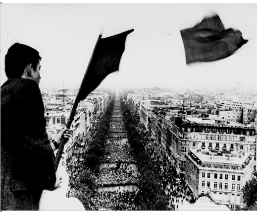
Μάης του '68, Παρίσι