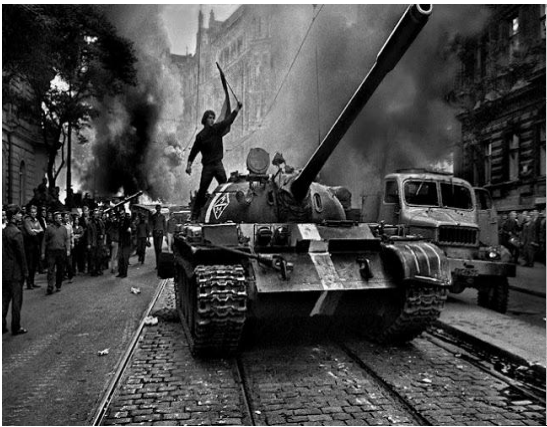
Άνοιξη της Πράγας

Σύμφωνα με αρκετούς μελετητές και ένα τμήμα του κομμουνιστικού κινήματος, οι εξεγέρσεις των εργαζομένων και του λαού στις χώρες του ανατολικού μπλοκ (οι οποίες στράφηκαν εναντίον της κομματικής/κρατικής άρχουσας τάξης των χωρών αυτών), είχαν ως περιεχόμενο την βελτίωση των όρων διαβίωσης και την εμβάθυνση των πολιτικών ελευθεριών προς όφελος της κοινωνικής πλειοψηφίας. Σύμφωνα με άλλους μελετητές και τμήμα του κομμουνιστικού κινήματος, οι εξεγέρσεις στις χώρες αυτές αποτέλεσαν αντεπαναστάσεις με αντισοβιετικό και αντικομμουνιστικό περιεχόμενο και προέκυψαν ως αποτέλεσμα της υπονόμευσης των καθεστώτων αυτών από τις καπιταλιστικές χώρες.